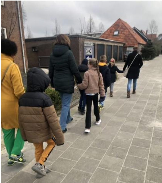
Filosofische denkwandeling met ouder(s)/verzorger(s) in Wolvega.