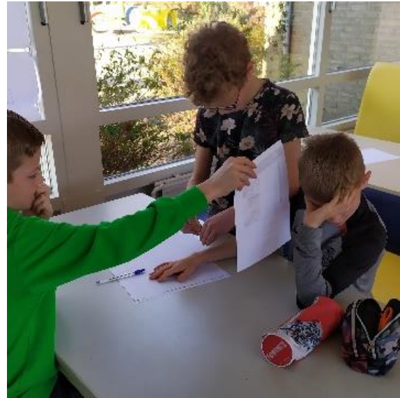
Proefje waarbij werd onderzocht welk deel van de arm het gevoeligst is voor prikkels.