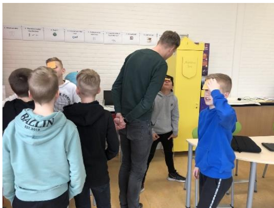
'Wie/wat ben ik?' te Oosterwolde.

De leerlingen kropen in de huid van een journalist en schreven een hoofdartikel, opiniestuk, informatief artikel en een interview of reportage. Deze publiceerden zij in hun krant of op hun website. Samenwerken was in de meeste gevallen essentieel om het geheel tot een goed resultaat te brengen. Sommige kinderen hebben zelfstandig een nieuwssite of krant gemaakt.