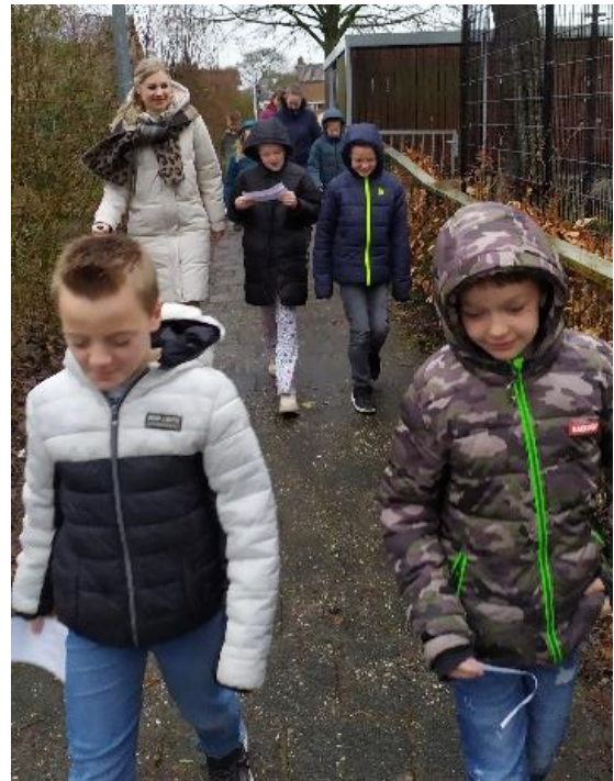
Filosofische denkwandeling met ouder(s)/verzorger(s) in Oosterwolde.

Ouder(s)/verzorger(s) konden dit blok deelnemen aan een filosofische denkwandeling in het kader van de week van de hoogbegaafdheid. Bedankt voor de grote opkomst!