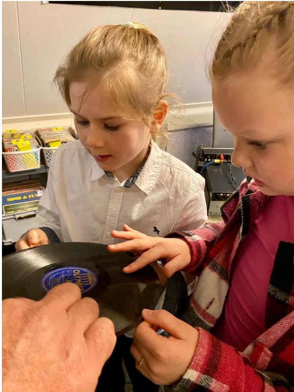
Leerlingen bekijken een bakelieten plaat.