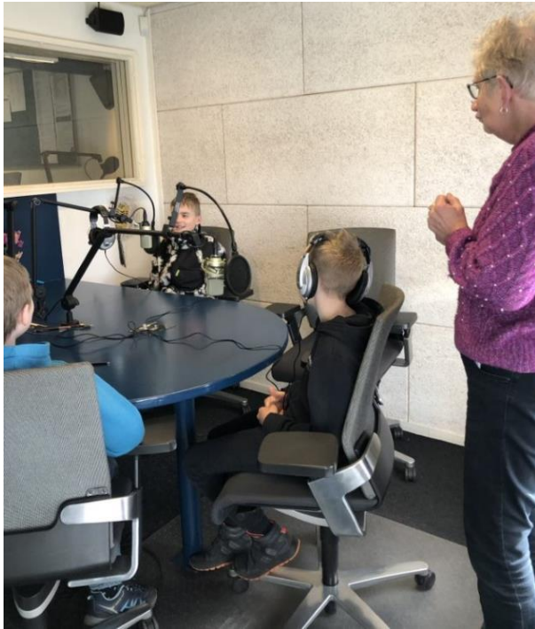
Excursie naar de lokale omroep Odrie.