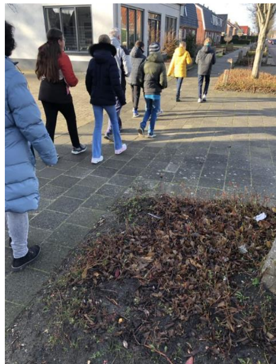
Filosofische denkwandeling met ouder(s)/verzorger(s) in Wolvega.