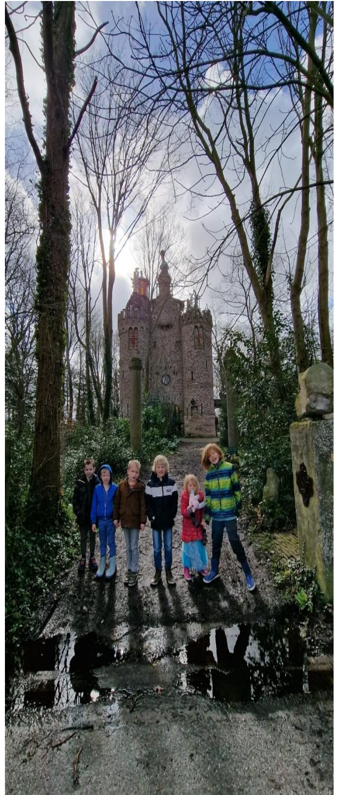
De onderbouw op bezoek bij Kasteel Olt Stoutenburght in Blesdijke.