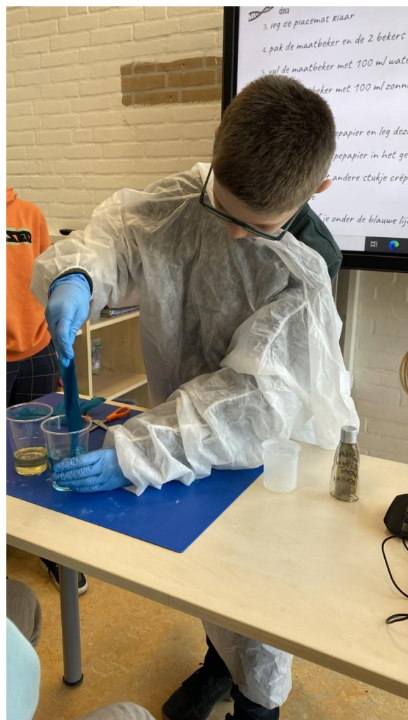
Aan de slag met proefjes over DNA.

Aan de hand van de stappen van het wetenschappelijk denkproces voerden de leerlingen uit de verrijkingsklassen proefjes uit die te maken hebben met het thema.