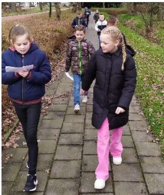
Kinderen aan de filosofische denkwandeling.

In Wolvega kwam meester Thomas met ons filosoferen en op de andere locaties werd een filosofische denkwandeling gemaakt. Tijdens de denkwandeling leren kinderen naar elkaars argumenten te luisteren en door te vragen. Aan het eind van een gesprek volgt een samenvatting of conclusie van de filosofische vraag.